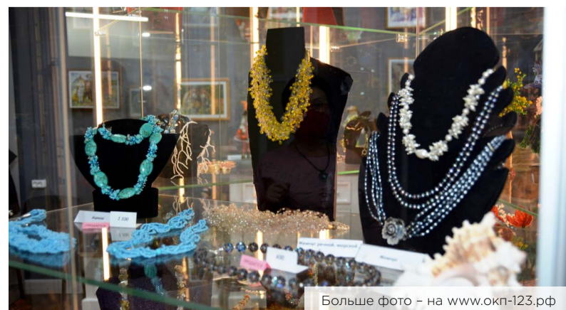
Больше фото – на www.okp-123.ru